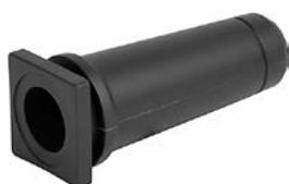
Kabeltülle KT14 PVC Knickschutztülle zu Kabelstecker